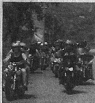
Passione due ruote Ad Amelia si vuole realizzare un museo

Il club motoristico "Il Magnetico" presenterà sabato prossimo un progetto per la realizzazione ad Amelia di un museo dei motori. L'idea nasce dall'operato dal club, che riunisce tanti appassionati di auto, moto e veicoli d'epoca di vario genere. Il club ha anche indagato la storia motoristica della città, tanto che la presentazione del progetto, prevista a palazzo Petriniani alle 11, sarà corredata da una mostra fotogra-